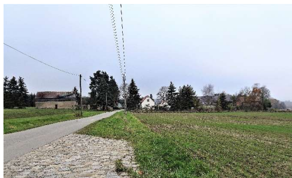
Zufahrt aus Richtung Leutersdorf, nördlicher Siedlungsrand

Die städtebaulich-planerische Zielstellung besteht im Erhalt des historisch gewachsenen, dörflichen Siedlungsteils. Für die im Geltungsbereich gelegenen bebauten Grundstücke soll eine moderate Entwicklung ermöglicht werden, dies jedoch unter der ausdrücklichen Prämisse, dass die bestehende Siedlungsstruktur erhalten bleibt.