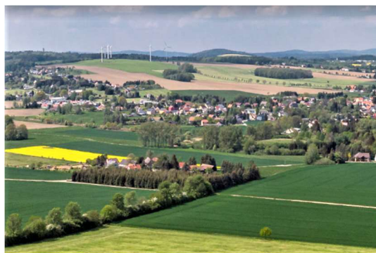
Aufblick auf den grünstrukturell abgegrenzten Siedlungssplitter der Folge im Vordergrund