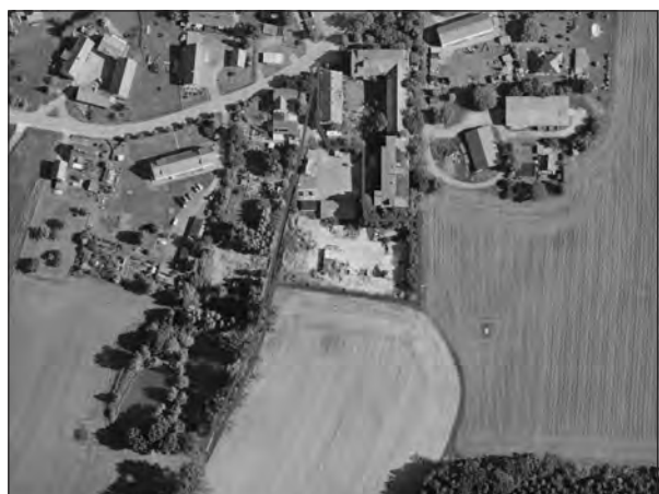
Abb. 2: Abgrenzung Geltungsbereich (GeoSN 12/2024)