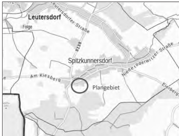
Abb. 1: Lage Plangebiet (GeoSN 12/2024)