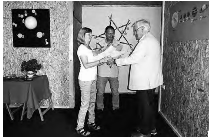
Glückwunsch zur Eröffnung des Miniplanetariums

Am 9. Juli 2021 wurde nach einer anstrengenden Bauphase durch die Familie Stern das Miniplanetarium auf der Poststraße 3a in Leutersdorf eröffnet. Dieses Miniplanetarium bietet unseren Kindern, Einwohnern und Urlaubern einen Blick ins Weltall. Die angebotenen Vorführungen und Filme ermöglichen unserer Schule, Kindergarten, Hort und dem Querxenland in Seiffhennersdorf die Möglichkeit, Unterricht und Nachmittage auch mit Bastelangeboten zu verbinden. Wir hoffen auch, dass dieses Angebot durch unsere Einwohner rege angenommen wird. Wir sprechen der Familie Stern ein großes Dankeschön aus und wünschen Ihnen für die Zukunft viele Besucher.