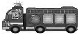
Eure Feuerwehr Leutersdorf

Der Förderverein sorgt für Speis und Trank, damit es ein informativer Nachmittag werde.