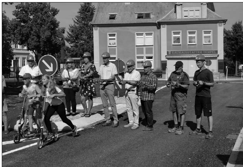
Freigabe der Kreuzung „Zittauer Platz“