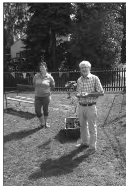
Kinderfest „Villa Kunterbunt“

Unseren Schülern, die in die wohlverdienten Sommerferien gehen, wünschen wir viel Erholung und schöne Erlebnisse mit ihren Eltern.