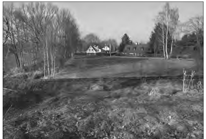
Nur die beiden Häuser rechts stehen in Josephsdorf

Wenn wir also vom Kastanienweg wieder zurück zur Seifhennersdorfer Straße gehen, vorbei an den Häusern der Wohnungsgenossenschaft (entstanden 1957–63), biegen wir sogleich in den Teichweg links ein. Hier in der „Spitze“ (Nr. 2) war einst die Niedermühle und der zugehörige niedere Teich auf der rechten Seite der Seifhennersdorfer Straße im Innenbogen der Kurve (heute Gärten). Auf unserem Flurplan von 1928 sehen wir noch den alten Straßenverlauf und den Mühlgraben. Wenn wir nun den Teichweg weiter gehen, kommt unsere Grenze also links heraus (nach Nr. 5) und bleibt auf der Straße, die wir weiter benutzen, um bald links in den Dammweg einzubiegen. Nach dem wiederholten Überqueren der Gleise (der letzte Zug fuhr hier 2006), erreichen wir ein Gelände beiderseits der Straße, das aufgeschüttet worden ist. Rechts schauen wir zum Ascheplan, für den das Landratsamt zuständig ist.