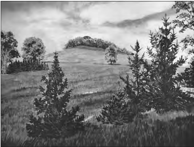
Großer Stein, Bild von Klaus Walther

Straße bleiben wir stehen. Von unten kommt unsere Grenze am Graben mit der Birkengruppe herauf. Hier ist sie gleichzeitig Enklavengrenze (historische Grenzmarkierung am Mast links).