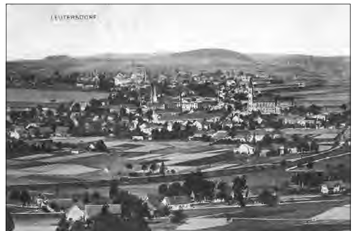
Josephsdorf – Blick auf einer alten Postkarte

genutzter Wald) des Meierhofes am Wege nach Spitzkunnersdorf 26 Siedler nieder. Anfangs hieß der Ort Josephidorf, benannt nach einem Mitglied der grundherrlichen Familie Liechtenstein in Rumburg.“