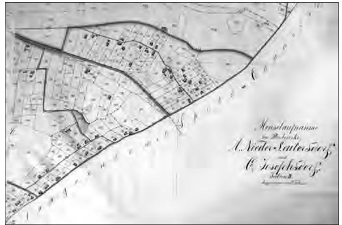
Josephsdorf (Ost), 1849

Auch der Neffe von Anton Florian, Josef Wenzel , geboren 1696, käme theoretisch als Namensgeber in Frage. Dieser wurde später berühmt (er hatte die Spanier und Franzosen besiegt) und übernahm 1718 die Herrschaft bis zu seinem Tode 1772. Danach hielten sich die Liechtensteiner nicht mehr direkt in Rumburg auf, sondern ließen verwalten.