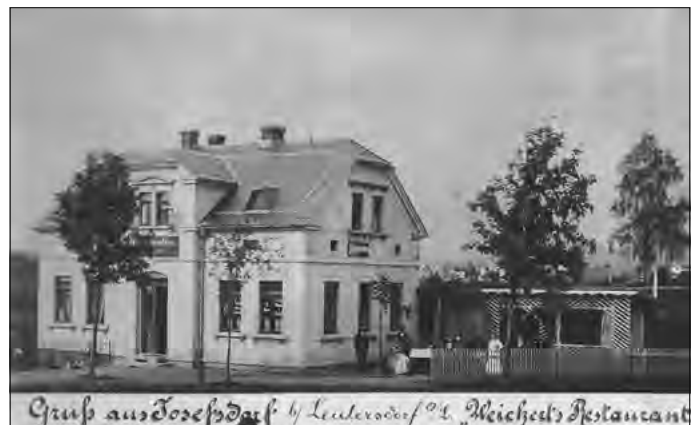
Am Dammweg 9 war auch einst ein Gasthaus