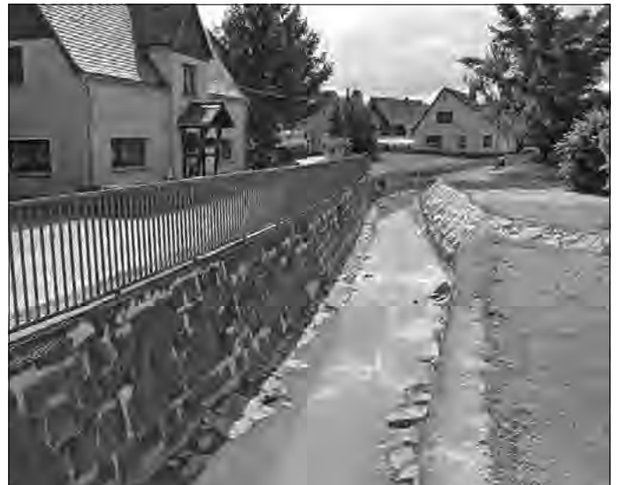
Jahnstraße bis Schmiedeweg