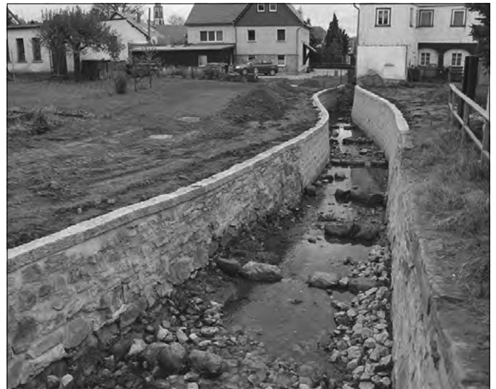
Am Wehr bis Kellerstraße