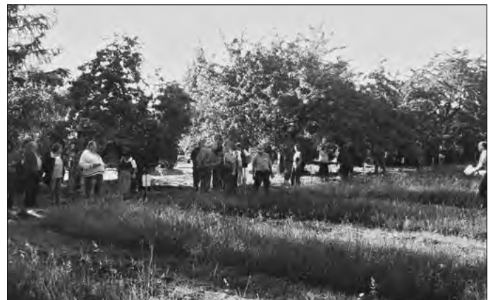
Kurz vor dem „Startschuss“ zum Sensenwettbewerb 2009

Nähere Informationen unter Tel.: 0 35 86/78 79 86 (bei Strietzel)