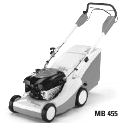
MB 455 M

Die starken Rasenmäher von VIKING: Fürs Mähen und Mulchen, für kleine und große Flächen. Exklusiv bei Ihrem VIKING Fachhändler.