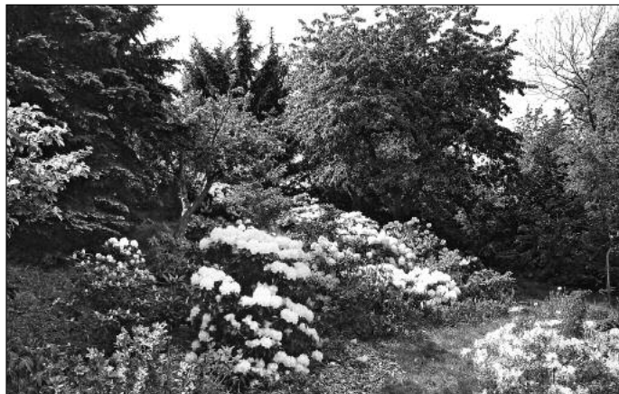
Rhododendron-Garten in Spitzkunnersdorf

Die Anwohner des Schmiedeweges haben bereits seit dem 14. Mai die Bauarbeiter vor ihrem Grundstück. Diese Straßenbaumaßnahme wird voraussichtlich am 8.6.07 abgeschlossen. Anschließend