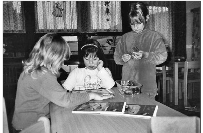
Auch bei den „Forstenzwergen“ wird experimentiert. Magnete sind für Kinder faszinierend. Manchmal stoßen sie sich ab. Warum bloß?