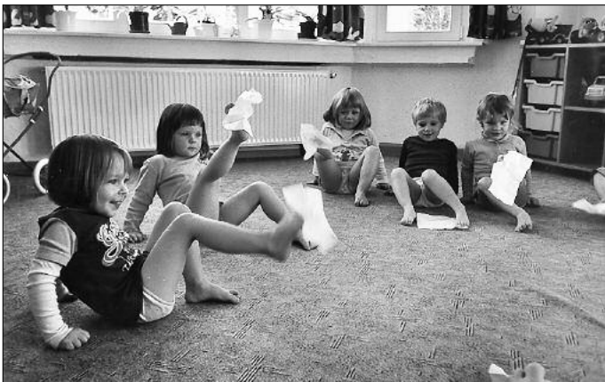
Das ist gar nicht so einfach, das Taschentuch mit den Zehen aufzuheben. Macht toll Spaß. Probiert es doch auch mal!