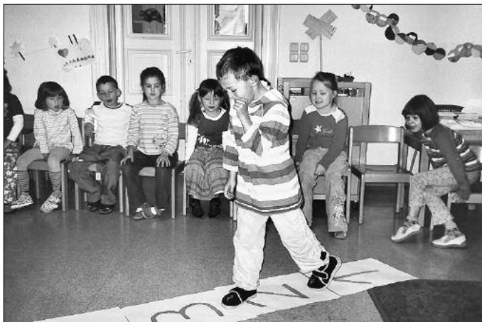
Durch Spiel und Bewegung lernen wir das Zählen.