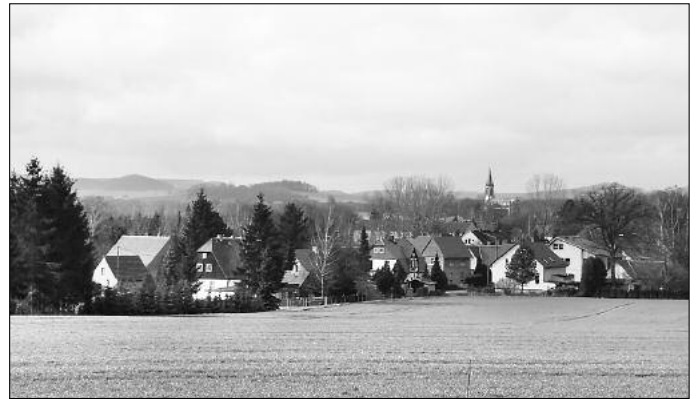
Blick vom Steinbruch zur katholischen Kirche