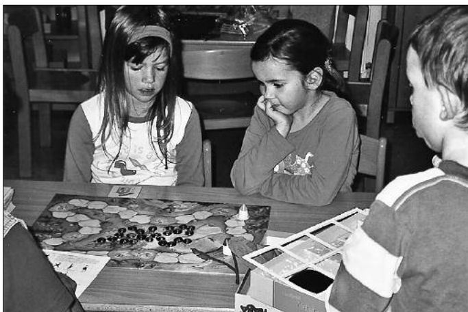
Viele Regeln sind einzuhalten, da muss ich genau nachdenken.