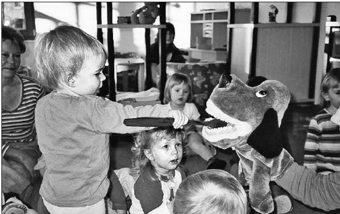
Zähne putzen ist wichtig! Spielerisch werden schon die „Kleinsten“ damit vertraut gemacht.