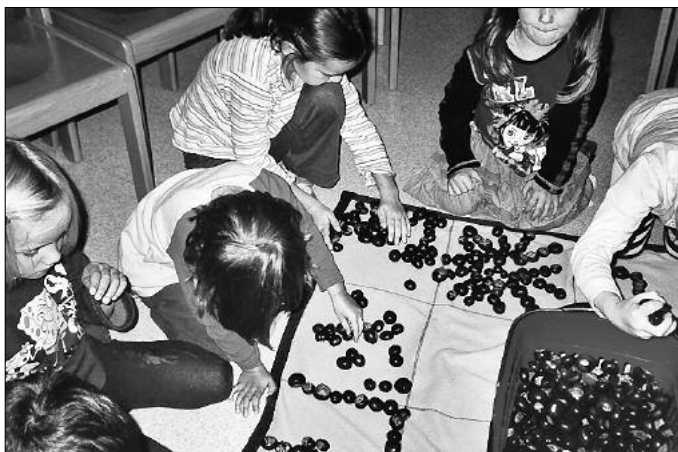
Mit Kastanien kann man wunderschöne Muster legen.