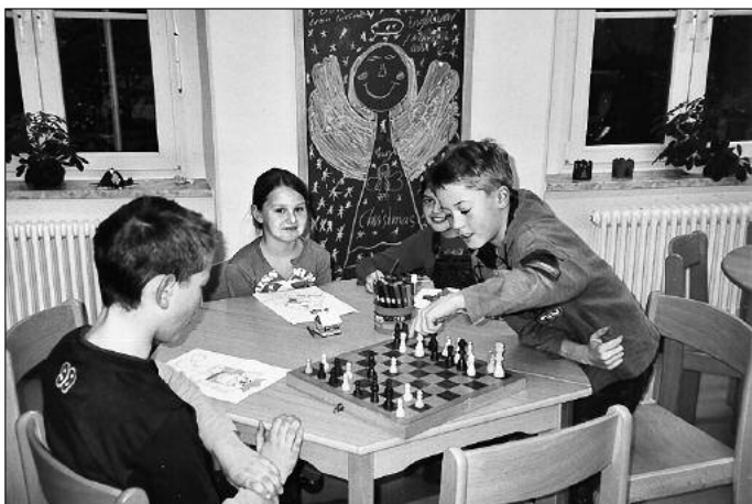
Hort – Knifflig, Knifflig. Welcher Zug ist richtig?