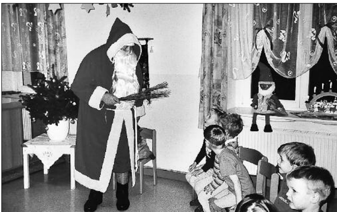
Auch der Weihnachtsmann hat uns wieder besucht und viele schöne Sachen gebracht. Danke!!!