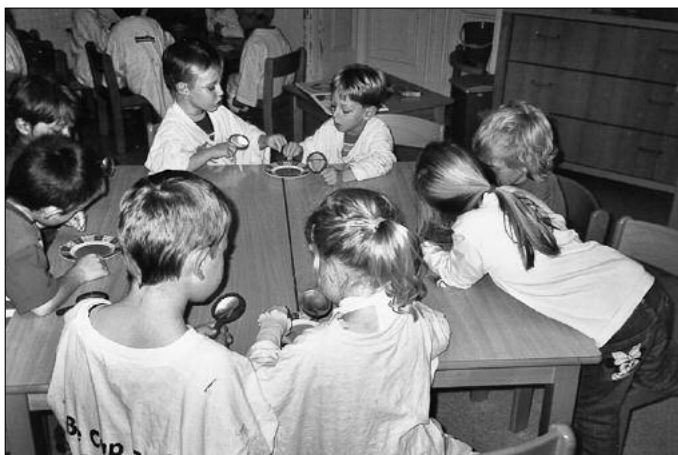
Was man so alles mit der Lupe entdecken kann.