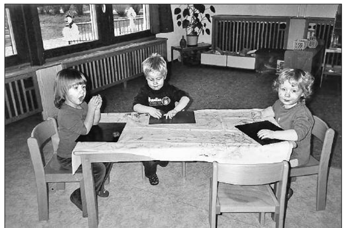
Mit meinen Händen kann ich viele schöne Sachen machen. Kneten macht Spaß und stärkt nebenbei die Muskeln.

Die Erzieherinnen der Kitas Leutersdorf/Spitzkunnersdorf