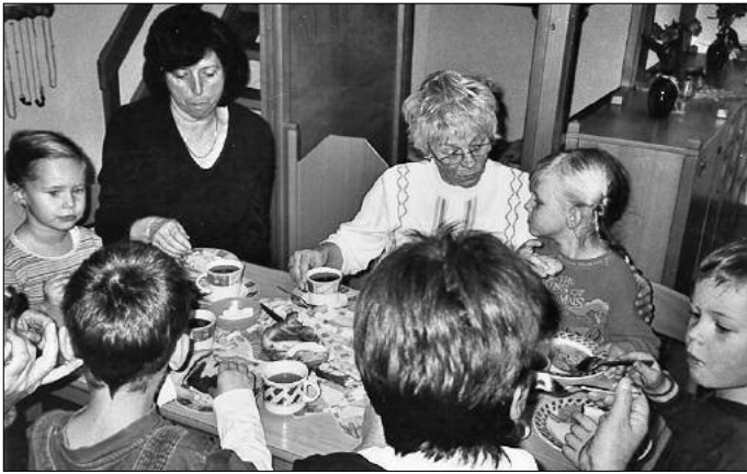
Oma Opa Tag, weil die Omas und Opas was „besonderes“ sind und wir sie ganz toll brauchen (sie uns auch).