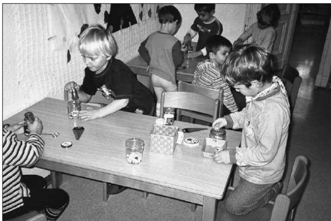
Mit Wasser zu experimentieren ist etwas ganz wunderbares (so schön nass).