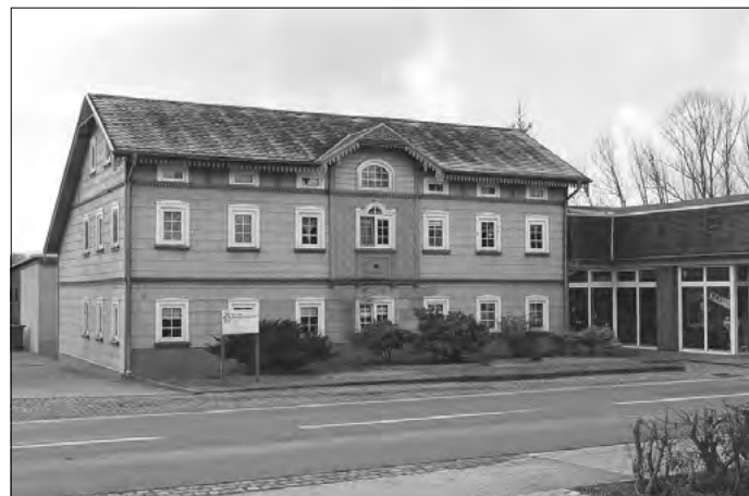
Blick auf Wohnhaus – Spitzkunnersdorfer Str. 12

Trotz dieser Veröffentlichung wurde vom Ortswehrleiter Spitzkunnersdorf noch zusätzlich eine Einladung für die Veranstaltung am 15. Januar an ausgewählte Einwohner von Spitzkunnersdorf übergeben. Diese gesonderte Einladung war mir als Bürgermeister nicht bekannt. Deshalb gab es auch während der Beratung im Heimatzimmer am 15. Januar gewisse Irritationen über die Bildung der Gemeindewasserwehr und die Veranstaltung.