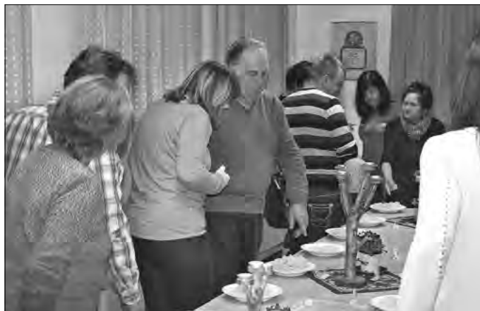
Unsere fachsimpelnden Gäste bei der Verkostung