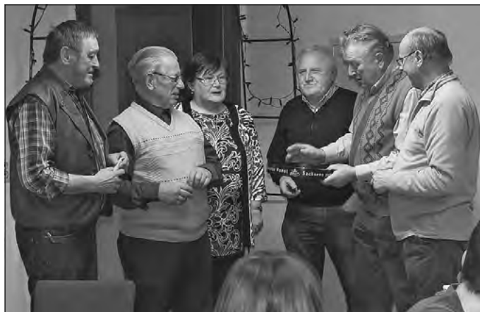
Zur Belohnung und besseren Verdauung gibt's ein Schnäpschen

Unser 19. Sauerkrautfest erwies sich damit wieder als ein gelungener Auftakt in das Vereinsleben 2018 – vor allem im Hinblick darauf, dass so viele Gäste wie noch nie in unser Vereinshaus kamen. Leider reichten unsere Plätze nicht einmal für alle aus. Das tat uns sehr leid. Hier müssen wir im kommenden Jahr eine Lösung finden – denn es ist mit dem 20. Sauerkrautfest ja dann auch ein besonderes Jubiläum. Wir freuen uns schon jetzt auf Euch und Sie und leckeres Sauerkraut.