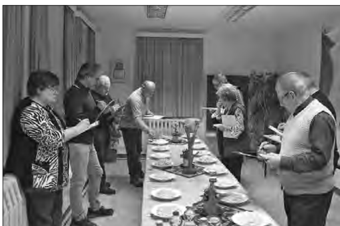
Die Jury bei der Arbeit