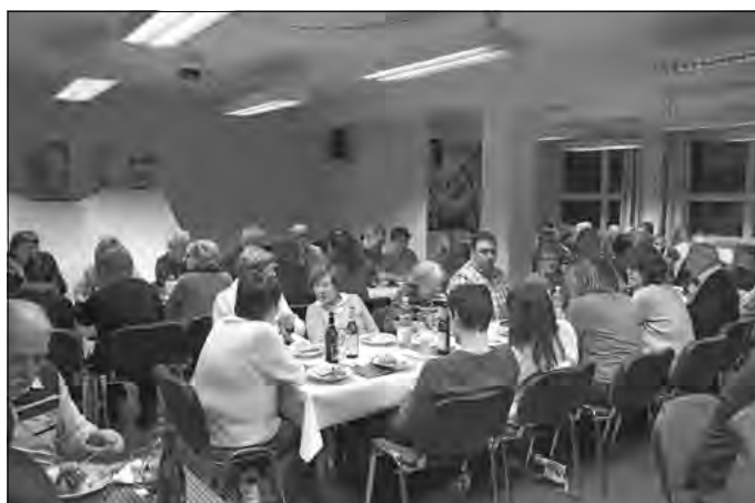
Wohlfühlen im gut gefüllten Veranstaltungsraum