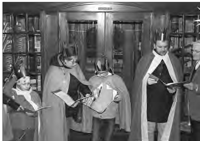
Sternsinger bringen Segen