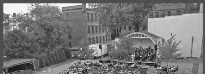
SCHÖN IST DIE WELT Sommer-Open-Air-Konzert Hof der KommWohnen Görlitz: 4. und 5. Juli Waldbühne Jonsdorf: 10. Juli