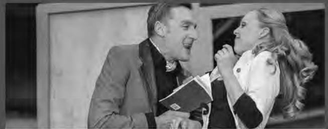
GRETCHEN 89FF. Komödie Klosterhof Zittau: 16. Mai – 14. August