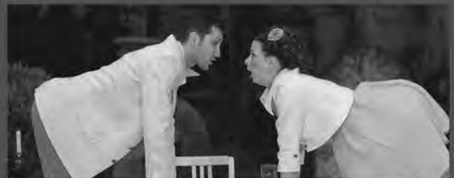
DAS SPIEL VON LIEBE UND ZUFALL Komödie Nikolaifriedhof Görlitz: 19. Juni – 10. Juli