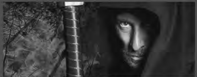
DER FLUCH VON OYBIN Abenteuerspektakel Waldbühne Jonsdorf: 4. Juli – 16. August