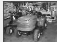
Rasentraktoren 12-24 PS Heckauswurf, Hydrostat ab 2200 EUR

Wir haben für Sie geöffnet: täglich von 7.30 bis 18.00 Uhr