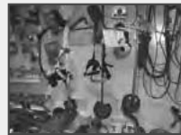
Motorsensen - verschiedene Größen von Husqvarna, Hitachi