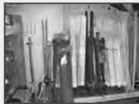
Weidematerial in großer Auswahl