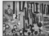
Ersatzteile für viele Geräte