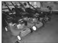
viele verschiedene Rasenmäher mit und ohne Antrieb