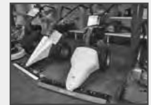
Balkenmäher und Einachser von Eurosystems