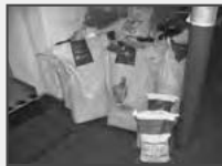
Futtermittel für Kleintierhalter - Hunde, Schafe, Hühner u.v.m.