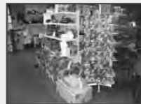
Quedlinburger Sämereien, Grassamen, Dünger u.s.w.