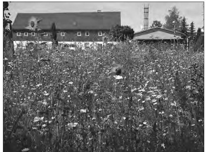
Blumenwiese vor Kita