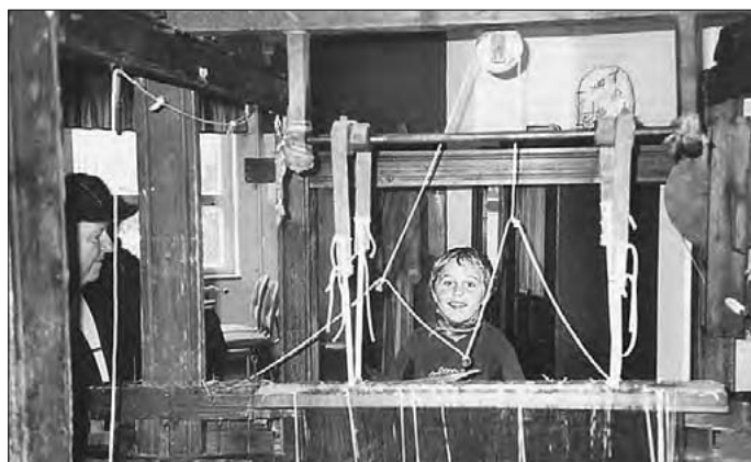
Seht her, ich bin der neue Weber.

mitgemacht. Das beim Stampfen des Sauerkrautes die Garkrüge zu Bruch ging, trübte die Freude nicht. Na ja, das Kraut wurde umgefüllt und wird zum Sauerkrautfest mit zu Verkosten sein. Vielleicht sind zum Plätzelfest auch einige Kinder mit ihren Eltern und dem Backgut bei uns zu Gast.