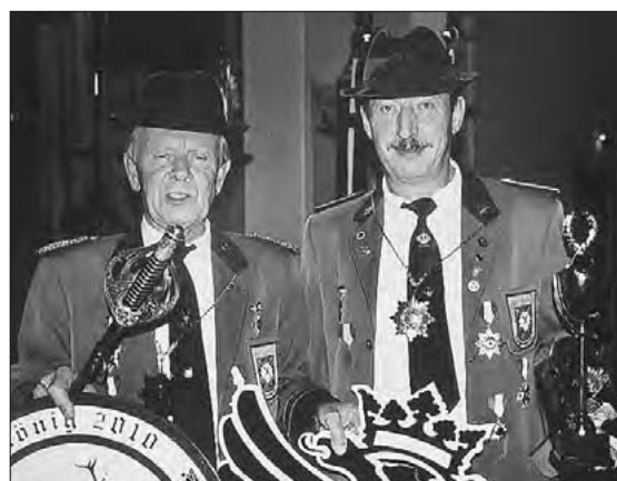
König und Marschall 2010

Anschließend erfolgte die Gratulation des Vorstandes des Schützenvereins sowie der befreundeten Schützenvereine.