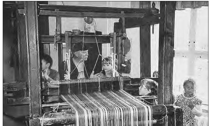
Junge Handweber hören den Ausführungen von Herrn Rudolf zu