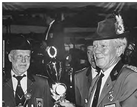
Pokalübergabe an den König SB Hielscher