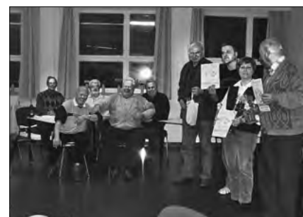
Unsere Skatspieler sind nach erfolgreichem Spiel in allerbesten Laune. Der Sieger ist rechts im Bild.