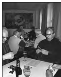
Und was sagen die Karten?

Wir freuen uns schon auf das nächste Skatturnier.