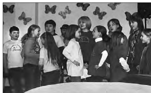
Die Spreequell-Finken aus Ebersbach begeisterten die Zuschauer mit ihrem vielseitigen und fröhlichen Auftritt.