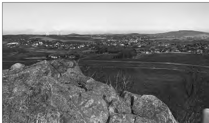
Blick vom Großen Stein