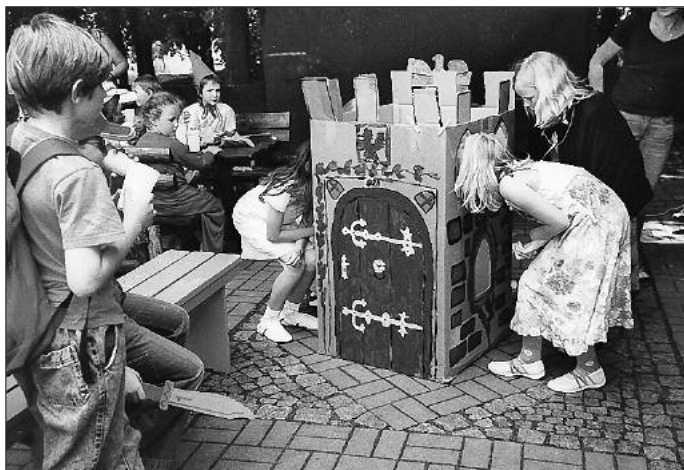
In unserer Ritterburg war der Schatz versteckt. Dabei mussten Schläue, Mut, Geschicklichkeit und Schnelligkeit bewiesen werden, um an den Schatz heran zu kommen.