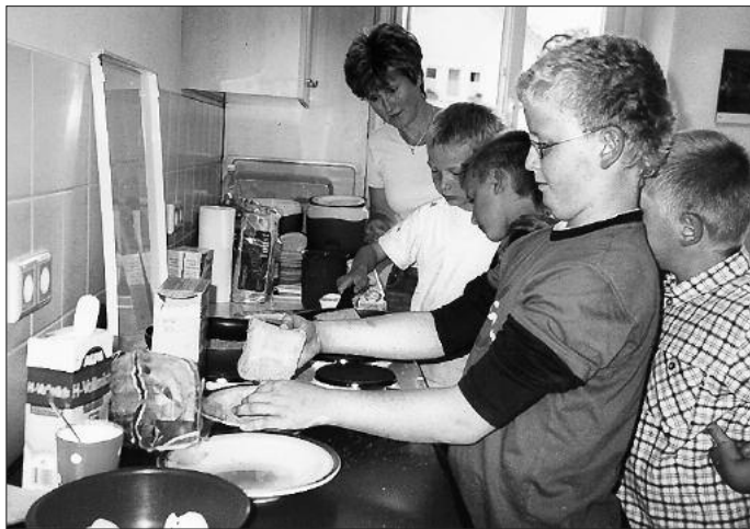
Zu den Vorbereitungen auf das Fest gehörte unter anderem, die Zubereitung eines Rittermahles „Armer Ritter“.