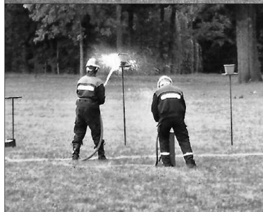
Mitglieder unserer Jugendfeuerwehr beim Wettkampf