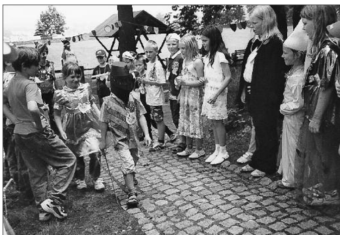
Bei unserer Ritter- und Feenmodenschau konnte jeder sein Kostüm vorführen.

Wir bedanken uns recht herzlich bei den fleißigen Helfern.