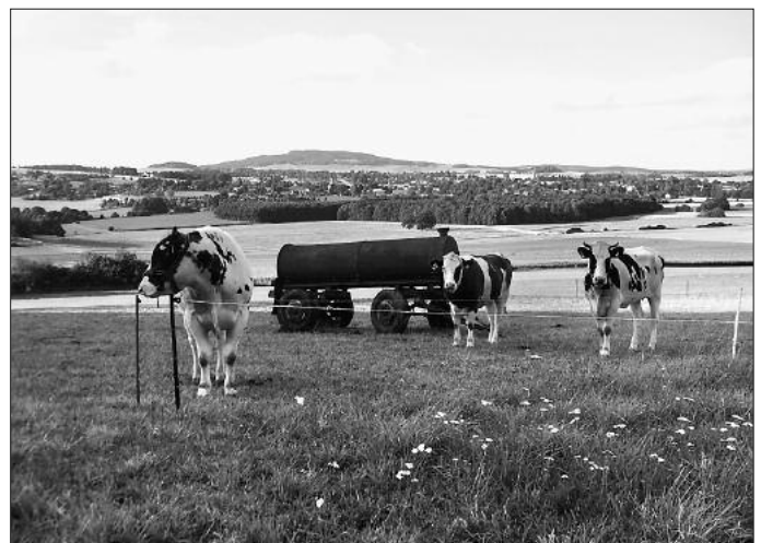
Blick vom Stolleberg auf Leutersdorf