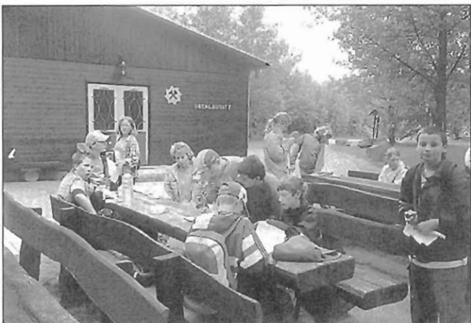
Rast am Lehrpfad