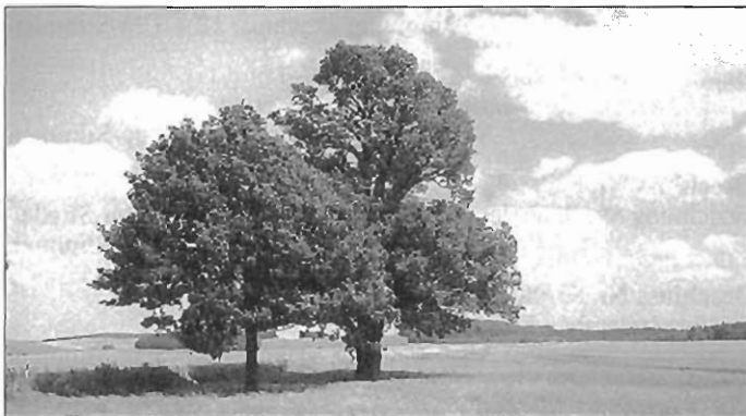
Eichen am Ortseingang Spitzkunnersdorf in Richtung Mittelherwigsdorf