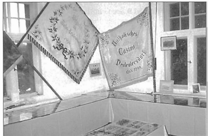
Blick in den Ausstellungsraum