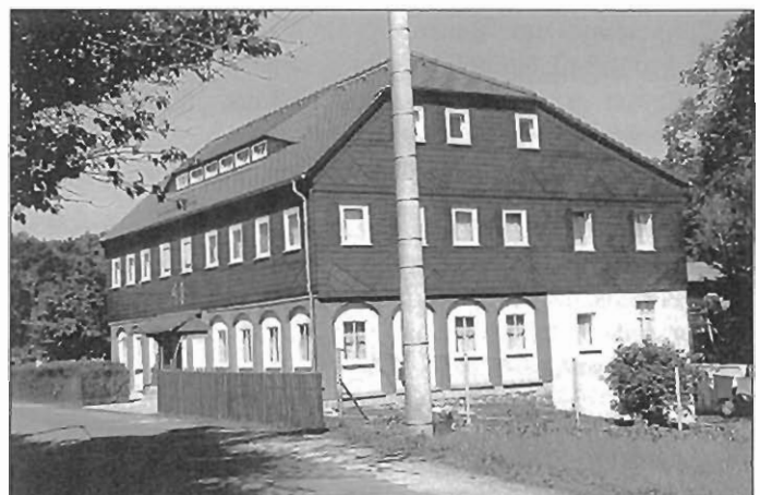
Wohnhaus – Friedensstraße 48