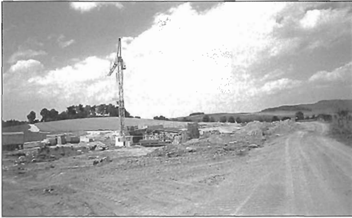
Bau der Ortsumgehungstraße im Juli 1999 zwischen Heinrichshöhe und Hetzemühle

Im März 1999 wurde mit dem Neubau der Ortsumgehungstraße Neugersdorf S 148 begonnen. Träger dieser Maßnahme war das Straßenbauamt Bautzen. Der Straßenbau erfolgte durch die Firma STB See GmbH.