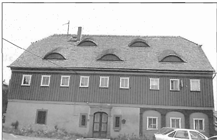
Weberstraße 2 in Spitzkunnersdorf