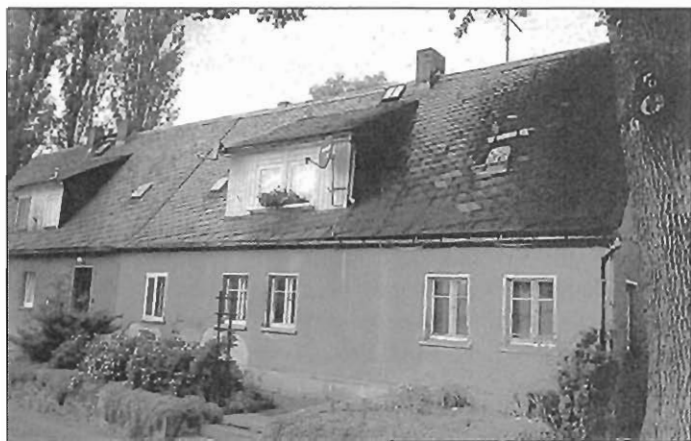
Kellerstraße 2 in Leutersdorf

Kaufinteressenten bitten wir, einen schriftlichen Antrag beim Bürgermeister oder Ortsvorsteher zu stellen.