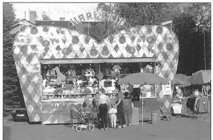
Leckerschdurfer Schiss'n 1999