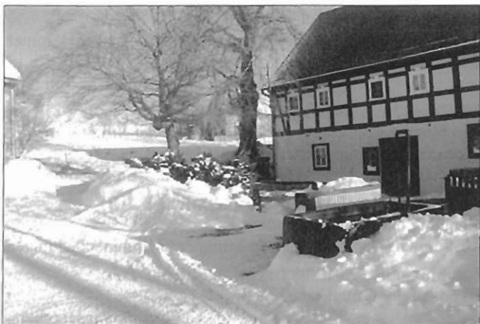
Spitzkunnersdorf, Am Hang

Ebenfalls am 13. Juni 1999 findet die Wahl der Kreisräte und die Europawahl statt.