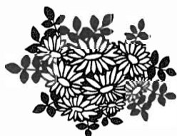
Bruno Scholze, Ihr Bürgermeister

A handwritten signature in cursive script, appearing to read 'Scholze'.